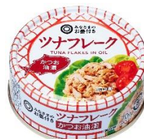
「ツナフレーク かつお油漬」 (70g / 98円)