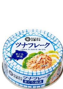
「ツナフレーク まぐろ油漬」 (70g / 98円)

新型コロナウイルス感染症の影響による生活スタイルの変化や節約志向の高まりに伴い、「より良いものをより安く」かつ「安心・安全」な商品が求められるようになってきており、プライベートブランドに対する期待やニーズも多様化してきております。そこで西友は、プライベートブランドの商品開発においても、原料の調達から製造・物流までサプライチェーン全体が統合された西友独自の調達モデルを導入。2019年7月に新設された専門性の高い調達チームによる市場マクロ環境分析に基づいた対象アイテム選定、原料調達、物流調整等を一貫通貫で実施することで、大幅なコスト削減による低価格かつ高い品質の商品開発と安定供給が実現し、本モデルによる初の「みなさまのお墨付き」商品として、9月28日に「ツナフレーク」の発売が決定しました。魚肉のやわらかさを生かし、マイルドな味わいに仕上げました。