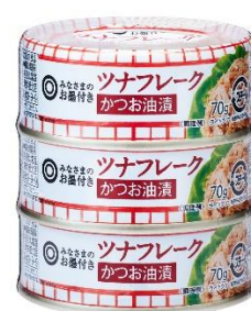
「ツナフレーク かつお油漬」 (70g×3 / 258円)