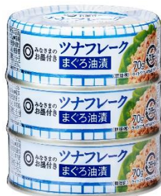
「ツナフレーク まぐろ油漬」 (70g×3 / 258円)