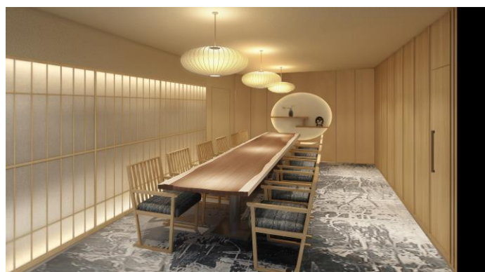
写真左から、「割烹みなと 個室へのアプローチ」、「割烹みなと 個室 HANARE」