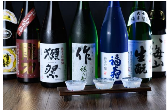
若女将厳選の日本酒