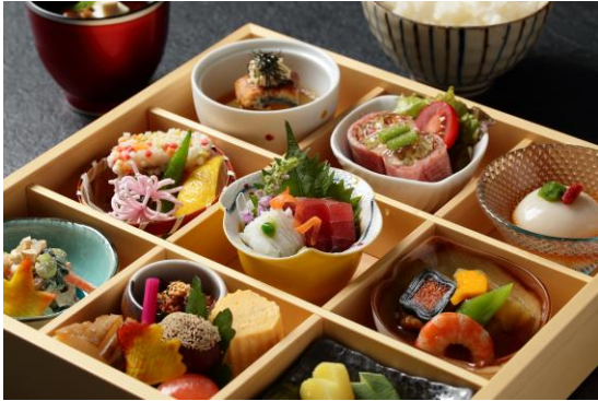
【Lunch】 季節感に満ちた小鉢料理を楽しめる 「旬菜御膳」 平日 2,400 円(税サ別) 土・日・祝 2,700 円(税サ別)