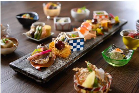
若女将オススメ料理