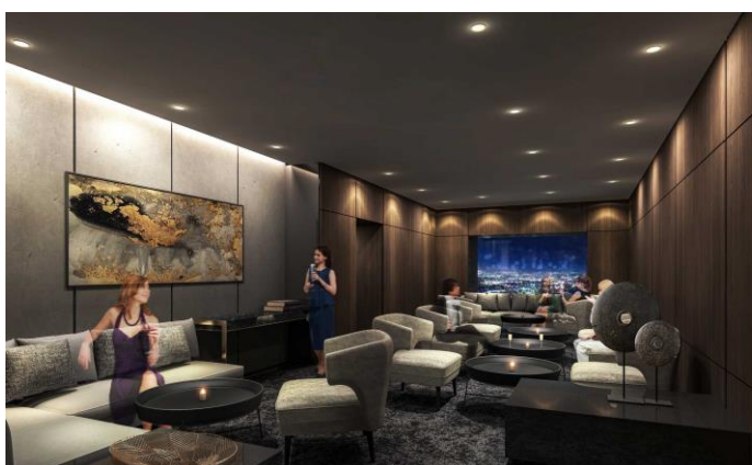
「BAR LOUNGE TWENTY」 パーティールームイメージパース

アートホテル大阪ベイタワーは、10月1日（火）同ホテル20階のレストランフロア内「割烹みなと」、 「BAR LOUNGE TWENTY」をリニューアルオープン致しました。