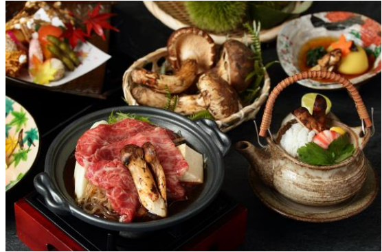
【Dinner】 季節の会席 神戸牛と松茸のすき鍋 土瓶蒸し付き会席 「紅葉」 8,000 円(税サ別)