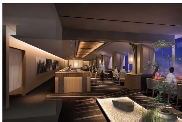
「割烹みなと」内装イメージパース (カップルシートイメージ)

ベイエリアの眺望を備えた20階のレストランフロアは割烹・鉄板焼・バーラウンジの3形態、今回は「割烹 みなと」を中心に内装デザインを刷新しました。