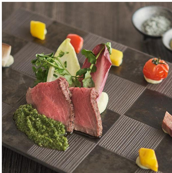
写真左から、フサキガーデンサラダ、石垣牛のローストビーフ 葱ユーグレナソース