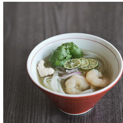
写真左から、アグー豚 二色の琉球小籠包とフカヒレのヌチグスイ薬膳スープ、アカマチのマス煮 ユーグレナの出汁、ユーグレナとシークワサー風味のフォー