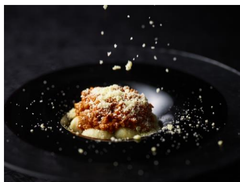
写真左から、「出来たてパスタ アスパラとベーコンのジェノベーゼ」、「ニョッキ・デ・パタテ・ソース・ポロネーゼ」

※食材を最高の状態で提供するため、当日の状態、仕入れ状況により内容が変更となる場合がございます。