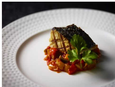
写真左から、「ハーブ・スパイス香るボルケッタ」、「サワラのグリル ラタトゥイユソース」