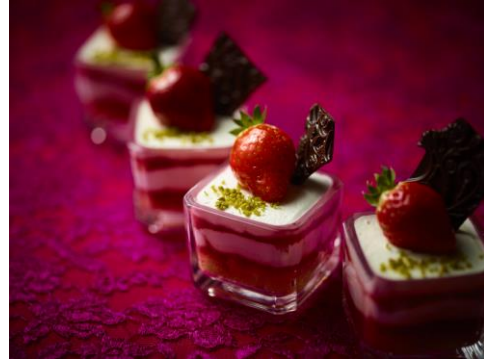
写真左から、「STRAWBERRY LOVERS / HIEROPHANT」、「TEMPERANCE」