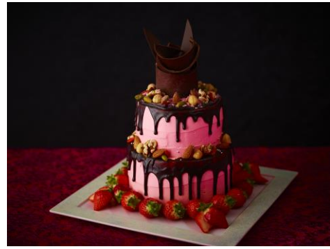
写真左から、「PINK EMPRESS」、「THE GOTHIC EMPEROR」