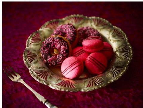
写真左から、「THE CHARIOT」、「WHEEL OF FORTUNE / SPRING MOON」