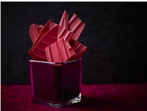
写真左から、「HEART OF THE FOOL」