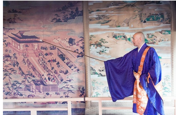
大御堂寺 野間大坊 絵解きの法話