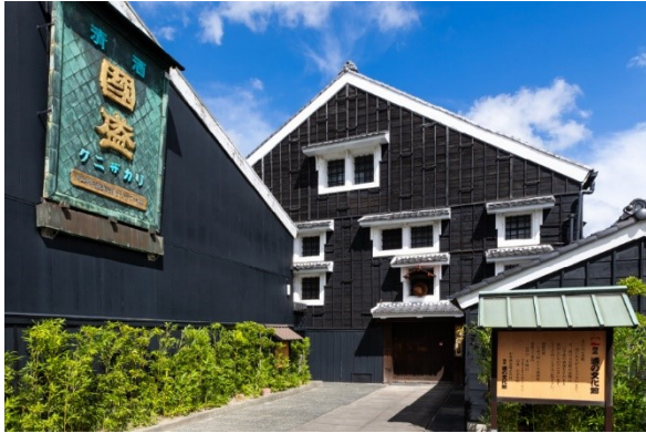
中埜酒造 國盛 酒の文化館

～國盛 酒の文化館、MIZKAN MUSEUM、野間大坊、南知多ビーチランドなど充実の体験メニュー～