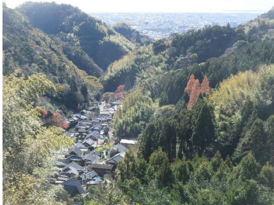
昔懐かしい山村集落「花沢の里」

～歴史情緒あふれる散策、焼津名産かつお薫焼き&鯉節工房見学、伝統工芸体験を満喫～