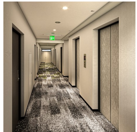
シンプルでスタイリッシュな廊下

2025年には1階～3階のエントランスやフロント、ロビー、客室の改装を予定しており、これからもお客様に新しい体験をお届けするホテルを目指します。ぜひ進化し続ける「ホテルマイステイズ日暮里」で、快適な東京滞在をお楽しみください。