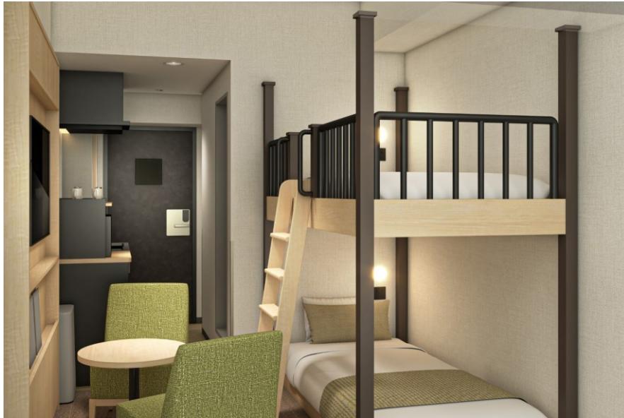
2段ベッドとキッチンを兼ね備えた新客室「バンクツイン」ルーム

ホテルマイステイズ日暮里（所在地：東京都荒川区、以下当ホテル）は、2024年9月より客室の段階的な改装を進めており、改装が完了したフロアから新客室の販売を開始しております。既存のセミダブル客室を「スタンダードダブル」として改装し、140cm幅のゆったりとしたダブルベッドを採用。また、12月27日より新たに「バンクツイン」ルームが誕生し、大人も楽しめる2段ベッドを備えた遊び心あふれる空間をご提供いたします。