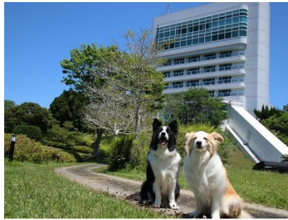
南紀白浜わんわんパラダイス