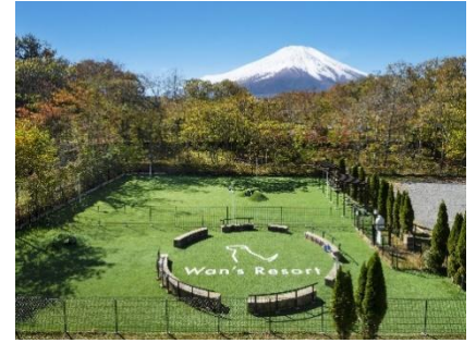
Wan's Resort 山中湖