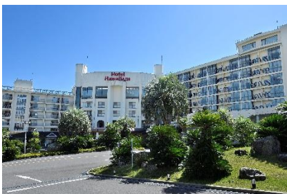
ホテルハワイアンズ