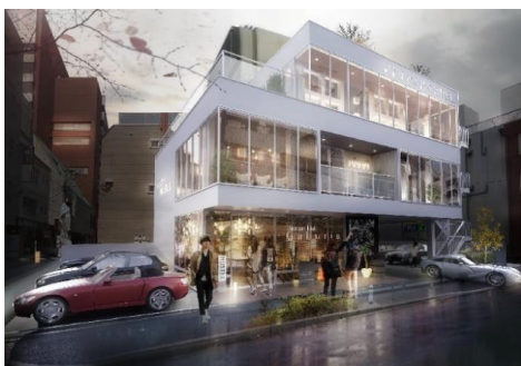
まゆ玉キャビン (横浜関内) イメージ