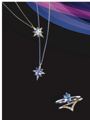
K18YG アクアマリン/ダイヤモンドネックレス ¥46,000 K18WG タンザナイト/ダイヤモンドネックレス ¥50,000 K18WG/YG タンザナイト/ ダイヤモンド セットリング ¥95,000 【すべてスペシャルパッケージ付き】