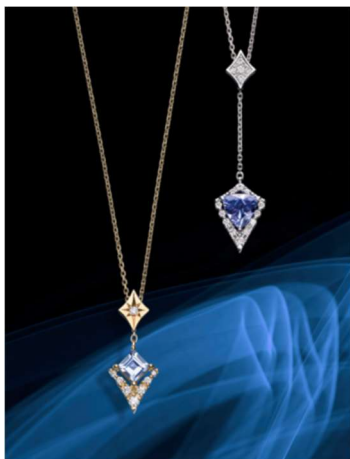
K18YG アクアマリン/ダイヤモンドネックレス ¥100,000 PT950 タンザナイト/ダイヤモンドネックレス ¥150,000 【すべてスペシャルパッケージ付き】

旬のトレンドストーンである紫がかったブルーが美しいタンザナイトや澄んだアクアマリンを、石の美しさを際立たせるように丁寧にカットし、ダイヤモンドでさらなる輝きを添えました。ネックレスの深い Y 字のラインは時計の針がモチーフ。ネックレストップをスライドさせて、チェーンの Y 字部分をお好みの長さに調節可能な 2WAY タイプ。自由にコーディネートしていただけます。