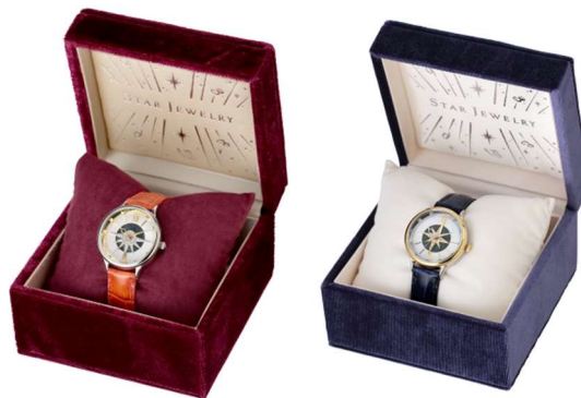
STEEL(YG フィニッシュ)クリスタルガラス/マザーオブパールウォッチ 各 ¥27,000 【スペシャルパッケージ付き】