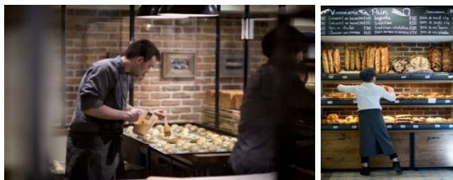
<メゾン・ランドゥメヌの職人たち>

イスリーが人々の生活の一部となりますように」というスタッフ一同の共通した想いを胸に、美味しいパンとお菓子を心掛けています。