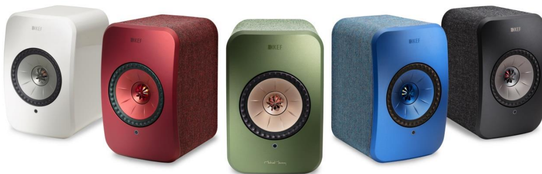
写真:グロスホワイト、マルーンレッド、オリーブ、デニムブルー、ブラック