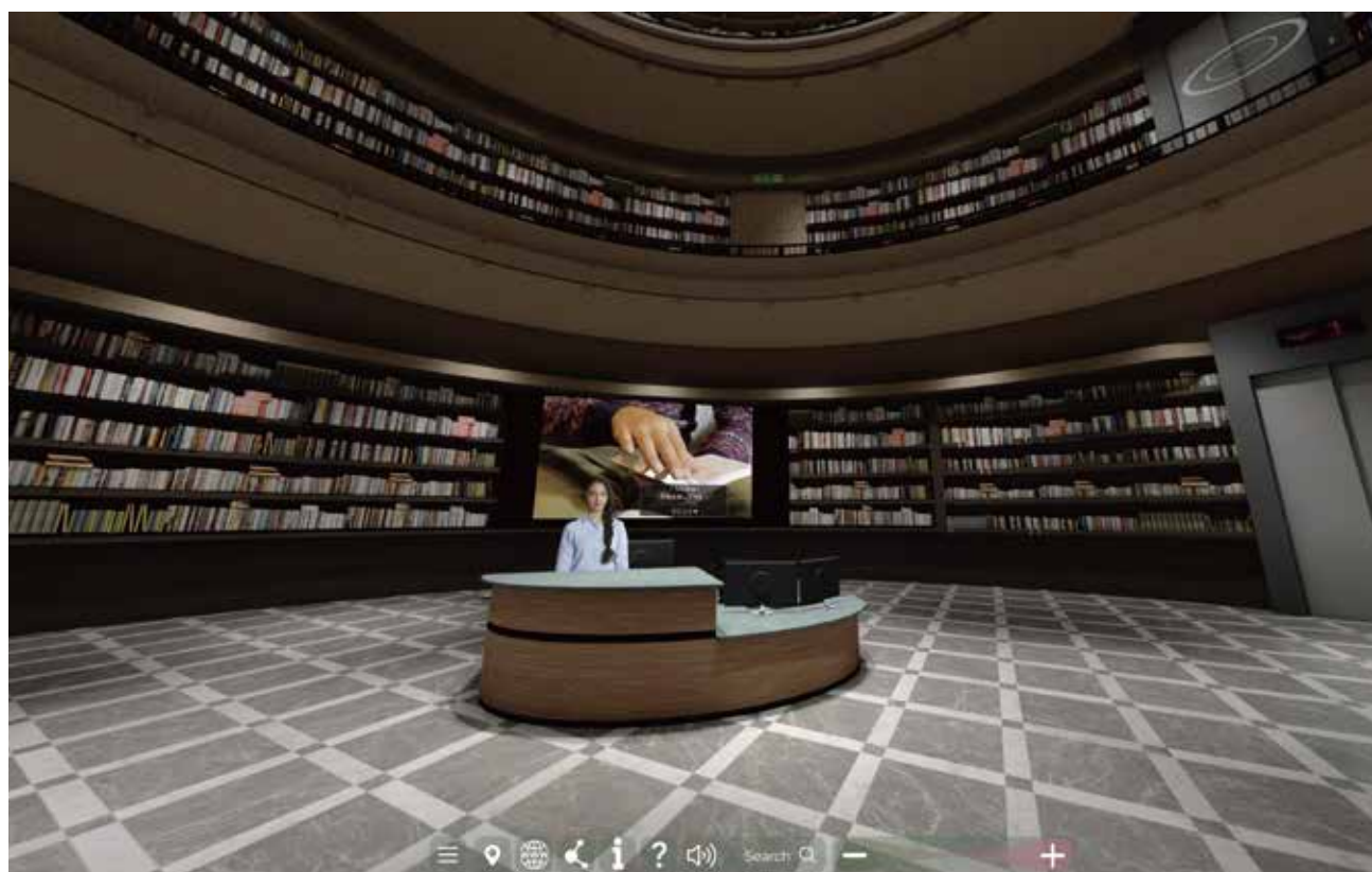
バーチャル図書館で収蔵品をデジタルアーカイブ

https://www.youtube.com/watch?v=CAyuVb0yFHI