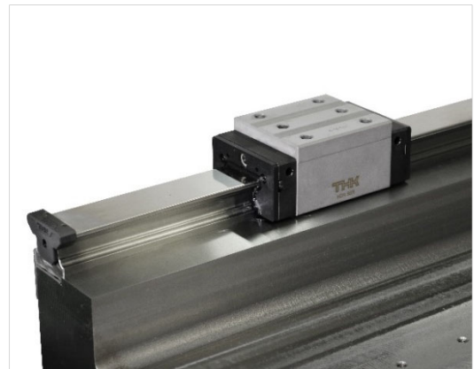
プレートカバー付き LM ガイド HDR

さらに、HDR20、25用の標準ラインナップにブロック高さを低くしたコンパクトブロックが加わりました。「HDR形」では、レールとブロックのセット品に加え、レールとブロックを単体でお買い求めいただけるGKシリーズの品揃えも充実しています。