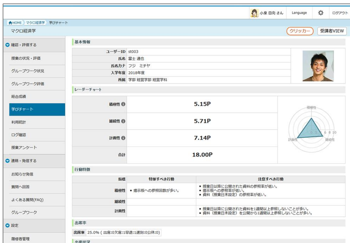
CoursePower V2 「学習行動の可視化・分析画面」

は、使いやすさを特長とし、豊富な教育・学修データを蓄積・活用することで、それを情報戦略へと拡大できる学修支援サービスです。学生数が数百人規模から数万人規模の大学まで、全学的な教育基盤として採用されています。(*4)