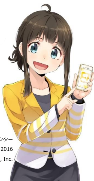
respon イメージキャラクター 小泉先生