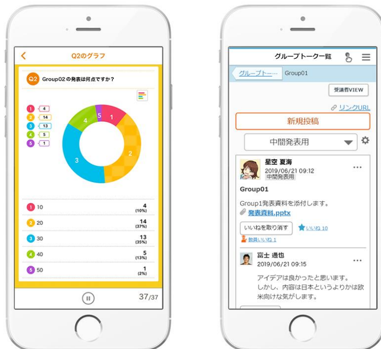
respon (左) と CoursePower V2「グループトーク画面」(右)

株式会社レスポ（本社：東京都千代田区、代表取締役社長：森田真基）が提供する教育機関向けリアルタイムアンケートシステム "respon (レスポ)" は、富士通株式会社（本社：東京都港区、代表取締役社長：田中達也）の「FUJITSU 文教ソリューション Unified-One 学修支援 CoursePower V2 （以下、"CoursePower"）」(*1)とシステム連携します。この新サービスは2019年10月にリリース予定です。