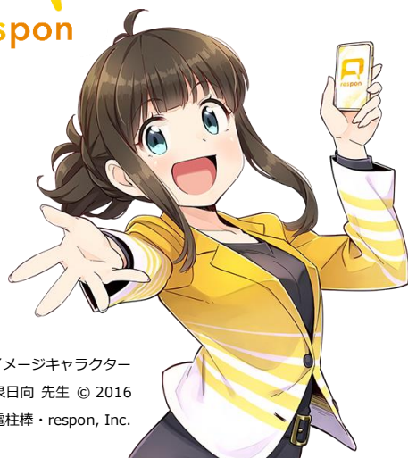
respon イメージキャラクター 小泉日向 先生 © 2016 電柱棒・respon, Inc.