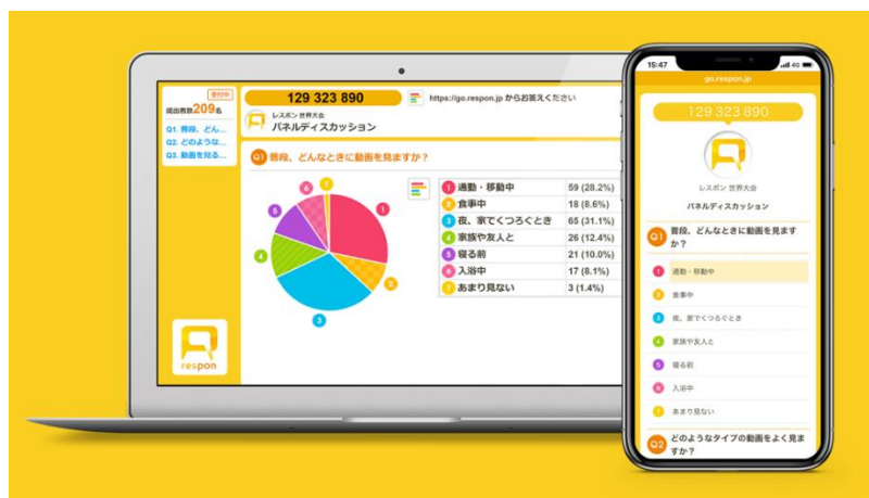
リアルタイムアンケートシステム respon (レスポ)