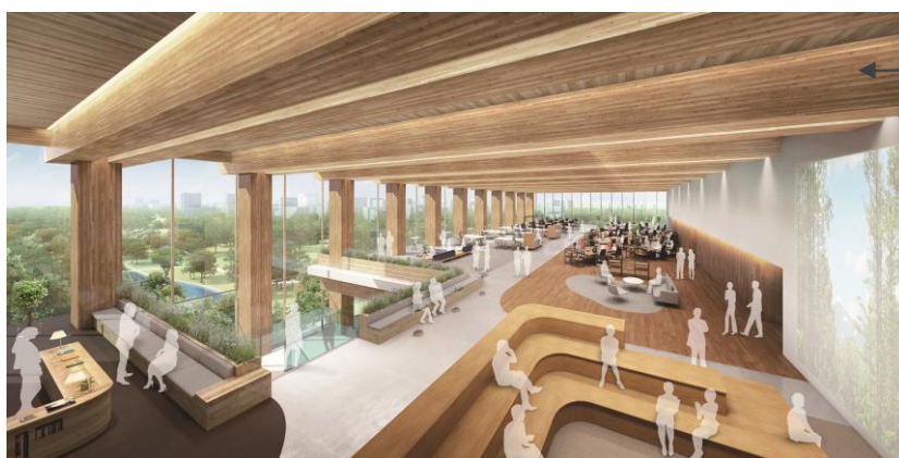
天井や壁の木目が見える温かみのある空間を実現

竹中工務店（社長：佐々木正人）、カシュー（社長：戸次強）、長瀬産業（社長：上島宏之）、ナガセケミカル（社長：荒島憲明）は共同で、スギ CLT ※1 に透明度・耐久性に優れた難燃化塗料を塗布した内装向けの準不燃材料を開発し、準不燃材料 ※2 の国土交通大臣認定を取得しました ※3 。建築基準法の内装制限 ※4 を受ける室内の天井や壁において、スギ CLT 表面の木目が見える温かみのあるデザイン性の高い空間を実現できます。