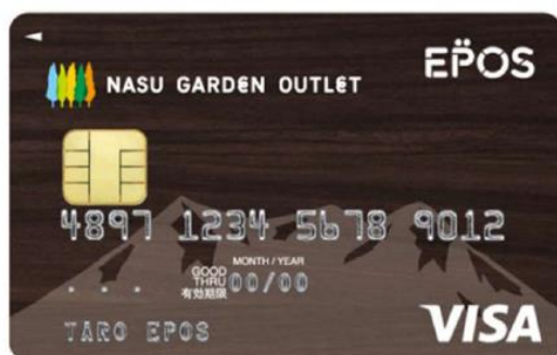
那須ガーデンアウトレットエポスカード 「山デザイン」

那須ガーデンアウトレットでは、お客様に安心してお過ごしいただけるよう感染予防対策を行った上で施設運営を行っております。ご来場の際には、マスク着用、手指消毒液のご利用、ソーシャルディスタンス(フィジカルディスタンス)の確保などご理解、ご協力の程、何とぞよろしくお願いいたします。