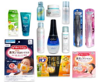
提供製品(3～4品をセット)