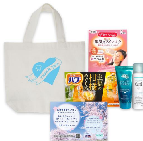
製品セットの一例

この活動は、ひとびとの暮らしのきれいを守ることを目的に花王が推進する横断プロジェクト「プロテクトJAPAN」 ※2 の一環として行なうものです。今回は、社会が一体となって感染拡大防止に取り組むとともに、お互いの立場を思いあう機運を醸成する一助になればとの考えのもと、1月21日より、生活者の皆さまから医療従事者の方々へのメッセージ ※3 も募集します。いただいたメッセージはカードに印刷し、提供するセット品に添えてお渡します。