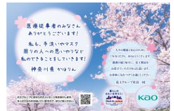
メッセージカードの一例