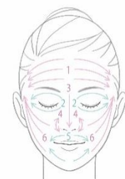
<顔全体になじませる>