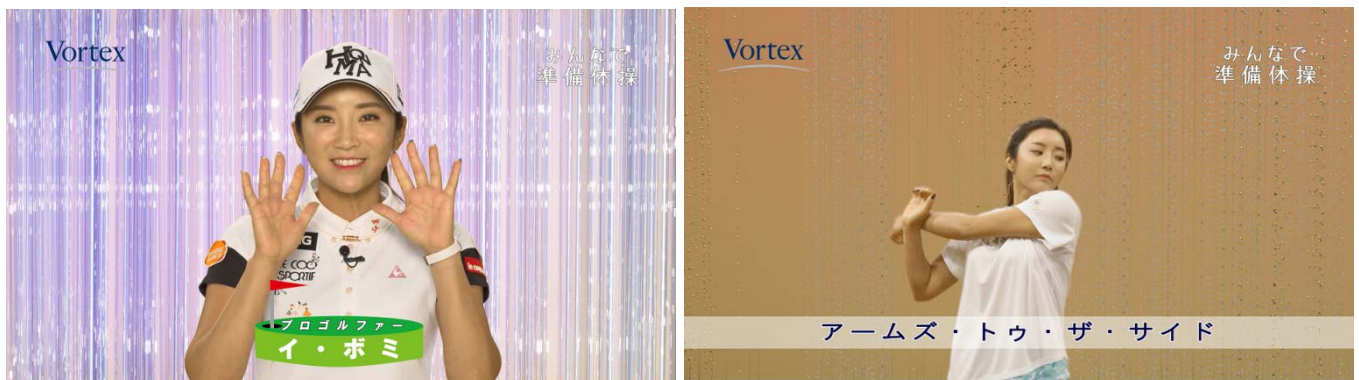
「みんなで準備体操」～ボルテックス×イ・ボミ～：イメージ画像

自身のパフォーマンスを限界まで引き出すには必須である準備体操において、イ・ボミプロがトレーニング・試合前に実際に行っている体のほぐし方やリラックス方法を盛り込んだ体操を本ムービーにてご紹介します。イ・ボミプロがトレーニングウェアで準備体操を行うシーンとミニ番組をモチーフに作成した本動画を是非、ご覧下さい。