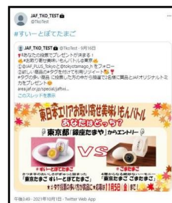
《ユーザー投票イメージ》

③ 投票の多い商品とJAF トミカセットを抽選で都道府県ごとに2名様に、合計で34名様にプレゼント