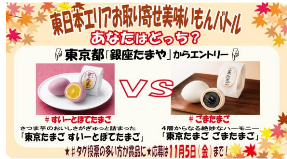
商品対決イメージ(例：東京都「銀座たまご」)

本キャンペーンは、Twitter アカウントを用いて北海道、東北、関東と3地方合計17企業と連携し、各地のお取り寄せできる選りすぐりの名産品を、参加ユーザーの投票によって都道府県ごとに対決する企画です。SNS上で各地の名産品対決に簡単に参加でき、単純に欲しい商品に投票するのか・多数派を予想して投票するのかをゲーム感覚で楽しめ、ユーザーは17企画すべてに参加可能です。