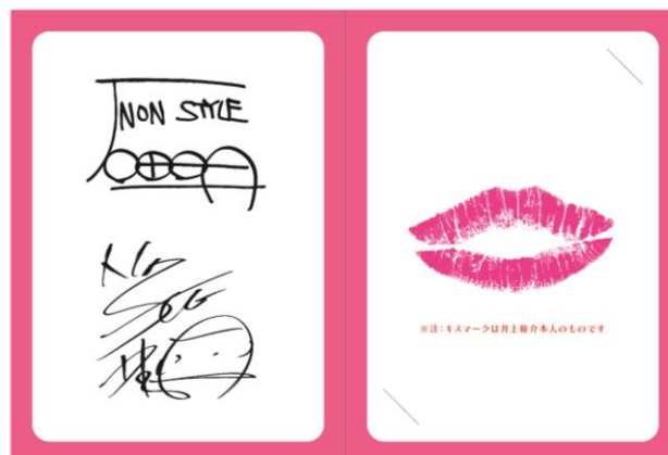
QUOカード台紙「井上さん本人のキスマーク」デザイン (右)