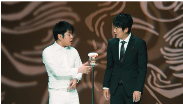
ボケ・ツッコミの役割も、普段とは逆に