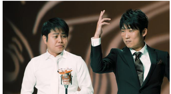
「ナルシストキャラ」を担当させられてしまう石田さん