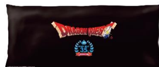
裏面共通デザイン