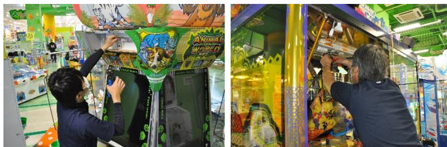
LED 照明 交換工事を行う 当社メンテナンススタッフ

遊戯機械の全台 LED 化工事は、電気工事士資格をもつ当社のメンテナンススタッフが実施いたします。交換工程を社内の専門資格をもつスタッフで内製化することにより、14,645 台にのぼる工事をより安全・確実に、また外注コストが発生しない形で実現いたします。