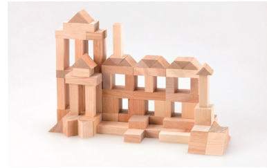
「第6の恩物」たてものの遊び

※クラウドファンディング・・・インターネットを通して賛同者から資金を集める仕組み