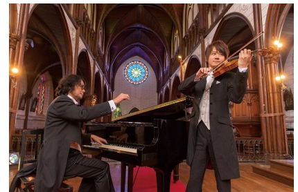
画像はスギテツ (9月25日出演)