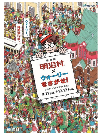
秋催事ビジュアル