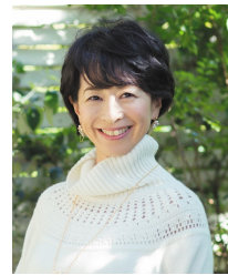
阿川 佐和子