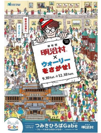
秋催事ビジュアル