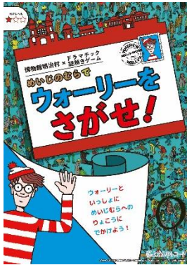
めいじのむらで『ウォーリーをさがせ!』