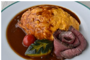
オムライス～みかわ牛のロースト ビーフ添え～（イメージ）