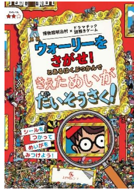
『ウォーリーをさがせ!』とあるはくぶつかんで きえためいがだいそうさく!