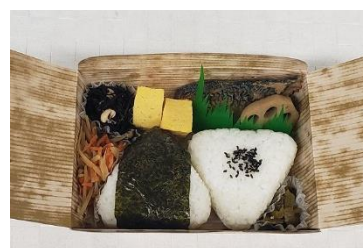
明治村おにぎり駅弁（イメージ）