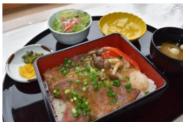
みかわ牛のステーキ重 （イメージ）