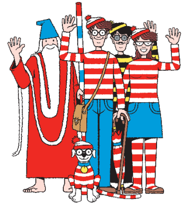
【主な登場キャラクター】 白ひげ(左)、ウォーリー(中央)、 ウエンダ(右)、オドロ(右後)、 ウーフ(中央前)

当館で人気を博す謎解きゲームを中心に、コラボグルメなど、人気絵本『ウォーリーをさがせ!』の世界観を通して、大人から小さなお子様まで、明治村で“明治”を楽しく学び、体感いただけます。