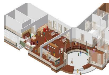
常設展示イメージ

その他にも「明治音楽祭」や「きもので歩く明治村」などの各種イベントを開催します。詳細等は明治村公式HPをご覧ください。