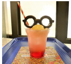
“ウォーリー” になりきれ！ クリームソーダ (イメージ)

その他、錦絵スタンプラリー「モノクロの世界で『ウォーリーをさがせ!』～色を重ねると現れる!?!～」や 10月30日(日)限定で「ハロウィン メイジムラ ボーダーデー'22」などを開催します。