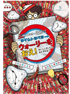
『タイムトラベラー ウォーリーをおえ!』 ～めいじじだいにもおとずれる!?!～