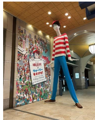
“ウォーリー”に扮した ナナちゃん人形 (昨年実施の光景)

○内 容／名古屋駅のシンボル「ナナちゃん」が、昨年引き続き 本年35周年を迎える人気絵本『ウォーリーをさがせ!』 の主人公“ウォーリー”のトレードマークである「赤白 ボーダー服」「青いジーンズ」「黒フレームのメガネ」 「ニット帽」を期間限定で身に纏って登場し、同村秋催事 「博物館明治村×『ウォーリーをさがせ!』'22」をPR します。