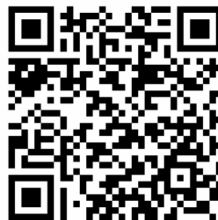
CIDP マイライフ LINE 公式アカウント 友だち追加用 QR コード