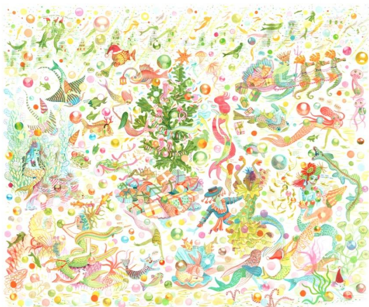
海の中でクリスマス祝う人々をイメージした原画