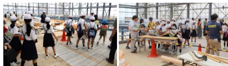
参考：第一回特別公開の様子（令和元年5月25、26日実施）