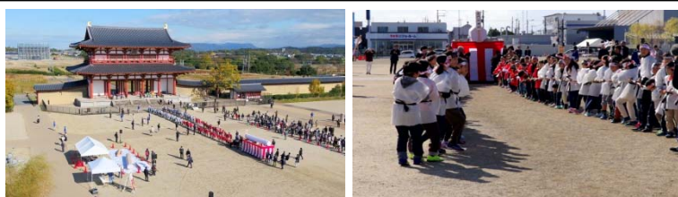
参考：木曳祭の様子（平成30年11月23日実施）