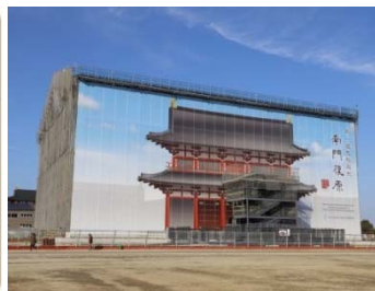
南門復原整備箇所