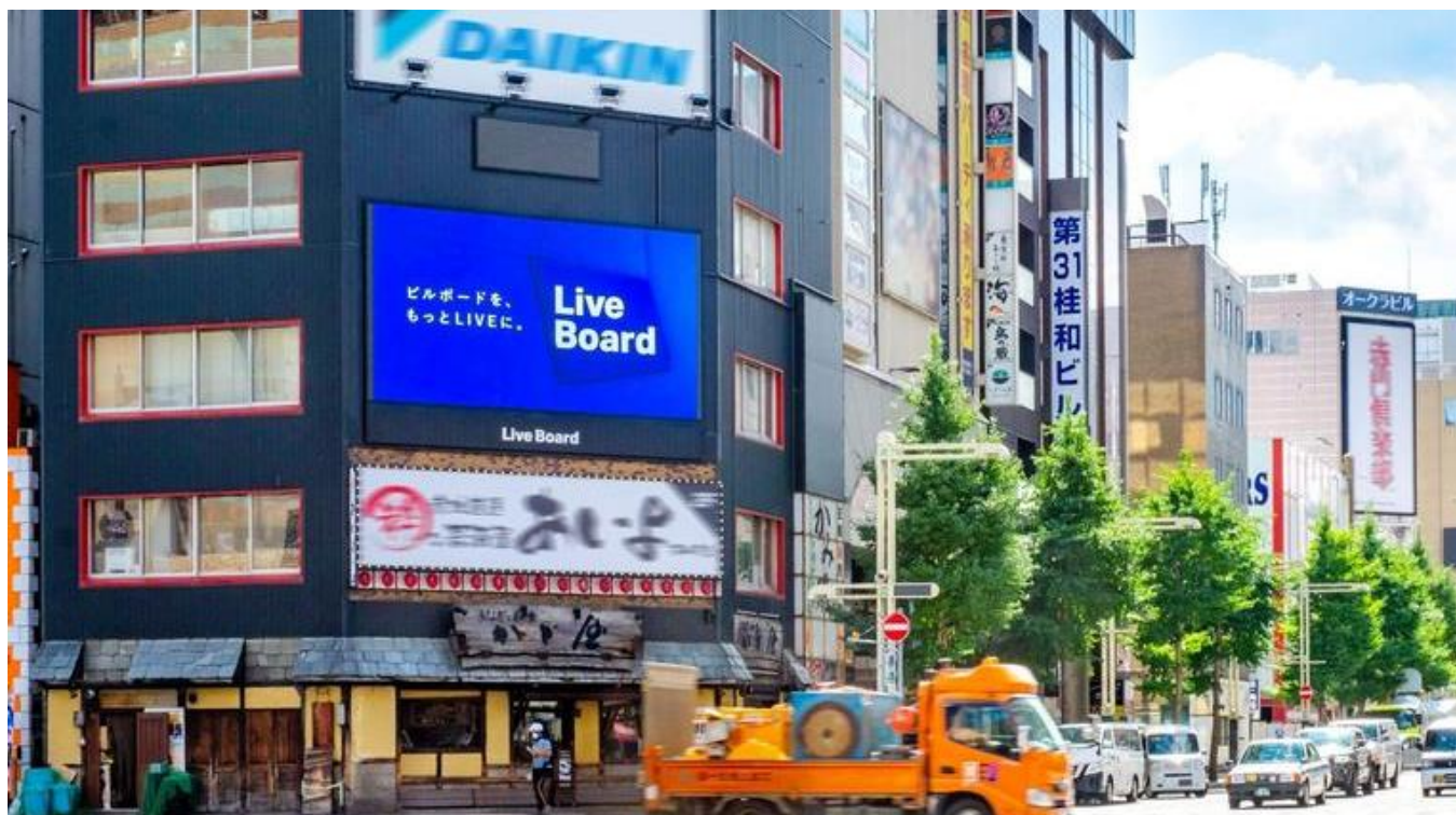
北海道・札幌_わたなべビル

株式会社 LIVE BOARD（本社：東京都渋谷区、代表取締役社長：櫻井 順 以下、LIVE BOARD）は、NTTドコモの「顧客理解エンジン ※1 」や「docomo data square TM※2 」等を活用し、LIVE BOARD 屋外ビジョンにおける分析を実施しています。今回、新型コロナウイルスによる規制緩和や外国人の受け入れ開始など、旅行需要に復調の兆しが見られる中、国内においては、7月から9月にかけて（夏休みやシルバーウィークの）バケーションシーズン直前という経緯より、LIVE BOARD ネットワークの対象となる全国約110の屋外ビジョンから 旅行好きが集まるビジョン を分析し、割合が高いビジョンをランキング化しました。