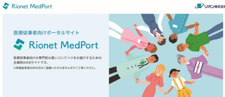
リオネット メドポート TOP ページ