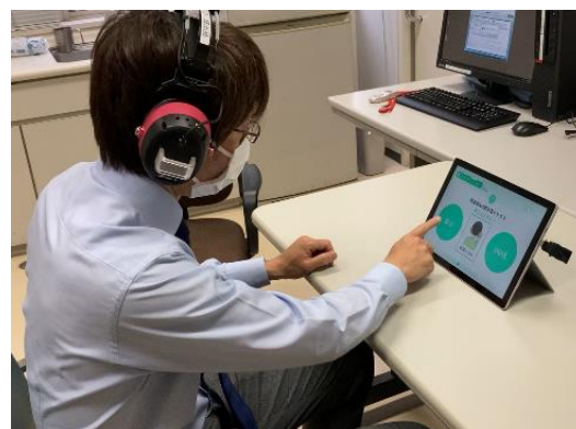
聞こえチェッカーで測定する様子

総合病院の待合室や薬局等に聞こえチェッカーを設置し、耳鼻咽喉科以外へ来院された方に待ち時間を利用して気軽に体験できることを目指しています。