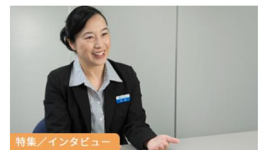
インタビュー記事が閲覧可能に

会員登録（無料）することで、お使いの補聴器を「my 補聴器」として登録できます。ご自身の補聴器や購入販売店の情報を、スマホなどでいつでもどこでも確認でき、販売店への連絡もスムーズに行えます。また、補聴器の開発者インタビューや販売店スタッフの対談などの会員限定記事が閲覧可能になります。さらに、各種イベントやセミナー、キャンペーンなどのお得な情報を受け取ることができます。