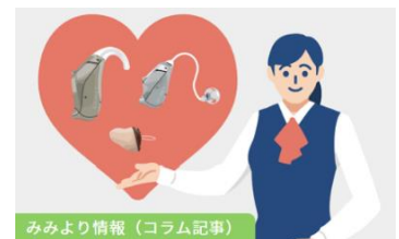
疑問点をわかりやすく解説

「補聴器購入までの流れ」や「補聴器の購入助成制度」などの耳より情報をコラム記事や動画で解説し、お困りごとや疑問点の解決につなげます。