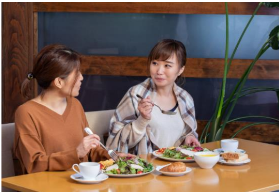
外部からの突発音(食器がぶつかる音など)を瞬時に抑制