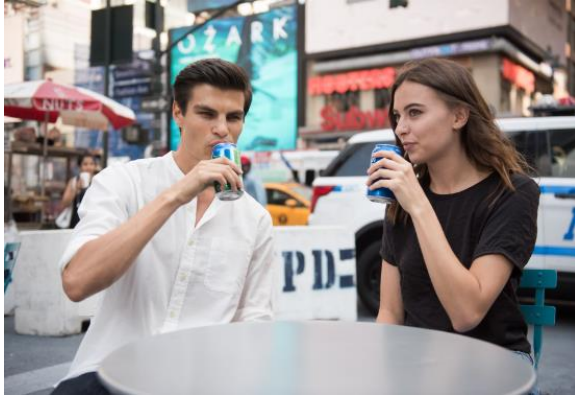
交通騒音などを低減