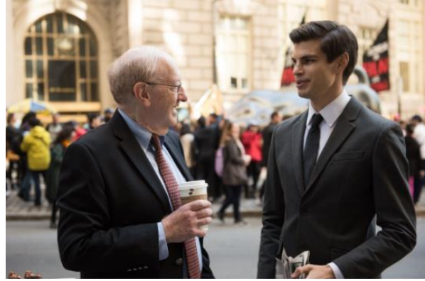
イヤホン装着時に感じる自分の声のこもりを低減