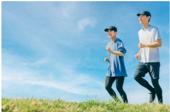
アクティビティを加速する風切り音抑制機能