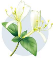
スイカズラ (イメージ)

紫外線を浴びると、複数の反応が連鎖的に起こり、かくれ炎症 → 日焼け → シミへと進行することがわかっています。かくれ炎症の段階でケアすること、つまり、“紫外線を浴びてしまっても、「日焼け」にしない美容成分”という発想から開発に成功したのが「キンギンカ抽出液」です。