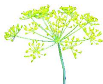
ディルシード (イメージ)