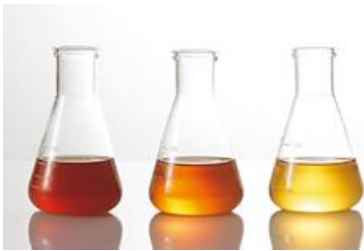
精製を繰り返し、色や濁りを取り除いた

開発当初は色や濁りに課題を抱えていましたが、試行錯誤を重ねることで、技術的に非常に難しいとされる“美容成分の効果はそのままだに色や濁りを取り除くこと”にも成功、高い抗炎症力を持つ美容液として完成させることができました。