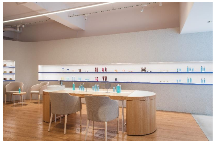
「デルメッド ショールーム」内観