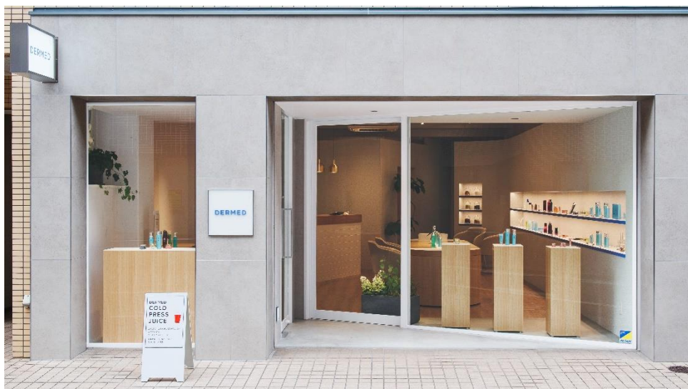
「デルメッド ショールーム」外観

美容成分の開発から化粧品づくりまで一貫体制で行う当社は、製薬のメソッドを取り入れた技術力が強みです。オリジナルブランド「デルメッド」は、「コウジ酸」など当社が開発した数々の美容成分の優れた効果をお客様にお届けしたいとの思いから 1993 年にスタートしました。シミ、シワ、たるみなど、肌や髪の悩みを感じ始める 30 代から 60 代以上の方まで、幅広い層の女性から多くの支持をいただいています。これまでネット通販をメインに展開してきましたが、「デルメッド ショールーム」を設けることで、デルメッドを多くの人に体験していただき、商品効果を実感・納得してご購入いただくことで、ファン層をさらに拡大していきたいと考えています。同時に、お客様の様々な声に耳を傾け、事業活動にフィードバックしていきます。