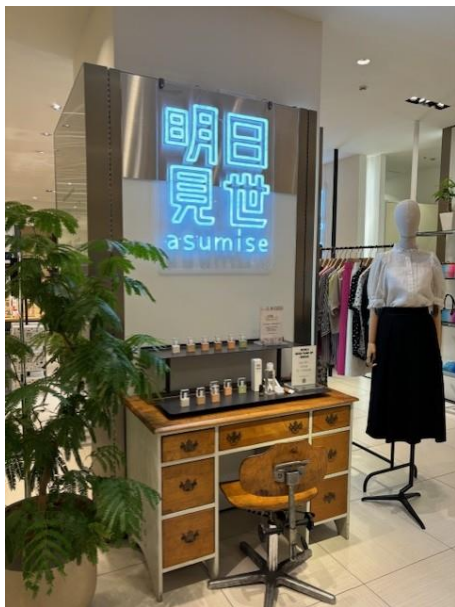
明日見世出品のイメージ

今回の「明日見世」では、開催期間の後半、出品ブランドの配置がリニューアルされます。