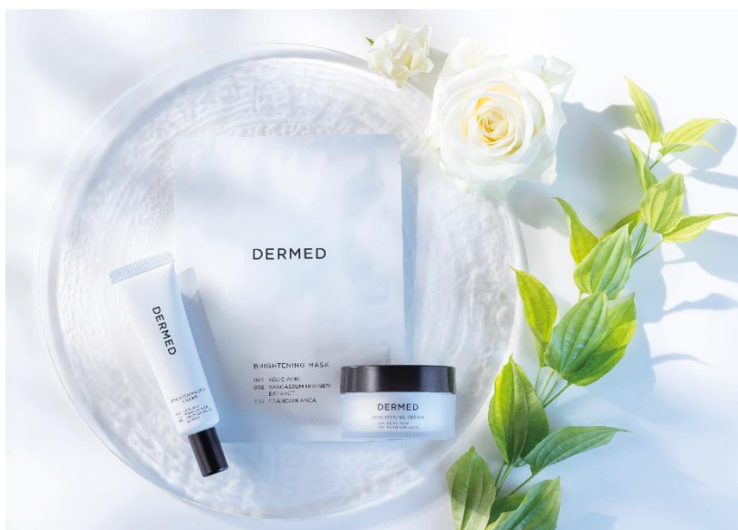
左から、ブライトニング クリーム、ブライトニング スポットクリーム、ブライトニング マスク

*8：「ローズマリーエキスホワイト」について https://www.sansho-pharma.com/lab/23 （三省製薬による実験）