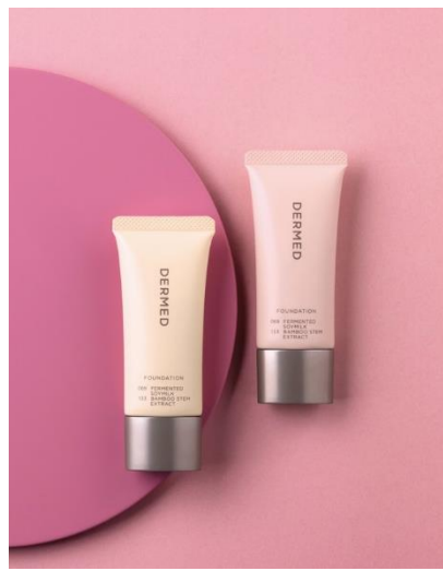
デルメッド ファンデーション