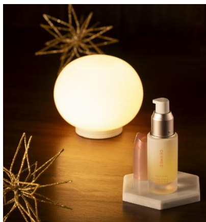
デルメッド ナイトリッチ