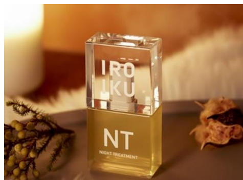
IROIKU ナイトトリートメント