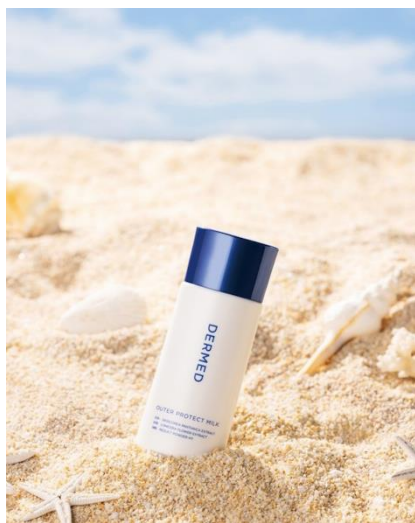
デルメッド アウタープロテクト ミルク

環境に配慮したオーシャンフレンドリー処方を採用した SPF50+・PA++++の日焼け止め「デルメッド アウタープロテクト ミルク」、光をコントロールするラディアンス ブレンド テクノロジーでツヤ感とカバー力を両立した「デルメッド ファンデーション」、睡眠中の肌の修復に注目した夜用美容液「デルメッド ナイトリッチ」、夜用高保湿美容液「IROIKU ナイトトリートメント」など、今年に入って発売した新品やバージョンアップ商品も、ご自由にお試しいただけます。どの商品にも、当社が独自に開発した自然由来の美容成分をたっぷり配合しています。