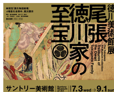
「徳川美術館展 尾張徳川家の至宝」

この高解像度画像は https://www.suntory.co.jp/news/article/sma0069.html に掲載しています。