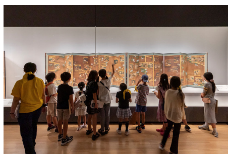
ツアー型プログラム(2023年の様子)