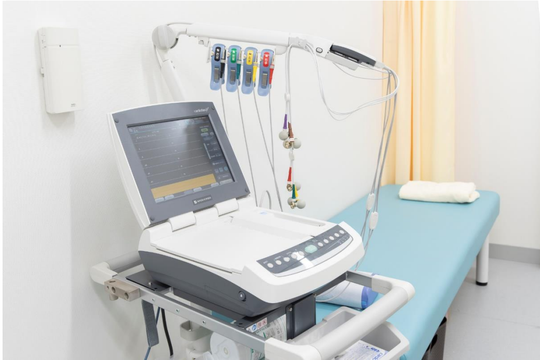
画像：そよかぜ内科検査室

翔和仁誠会は、2002年3月の本院「たかまつ耳鼻咽喉科クリニック」の開院以来、地域の患者様に「安心・安全かつ、専門性・先進性を追求した医療サービス」を提供することを目指してきました。これまで京王線沿線を中心とする東京・神奈川において、耳鼻咽喉科有床サージセンター1医院と、耳鼻咽喉科、内科、小児科、皮膚科・泌尿器科クリニック13院を運営しており、年間延べ44万人以上の患者様に来院いただいています（平成30年）。また、東京都三宅島での定期的な訪問診療を行うほか、中国・上海、カンボジア・プノンペンに定期的にグループ医師を派遣し、アジアにおける医療支援活動も行っています。本クリニックの開院により、これまで培った耳鼻咽喉科・内科領域の診療経験を活かして、地域の患者様に安全で、先進性を追求した総合的な医療サービスを提供いたします。