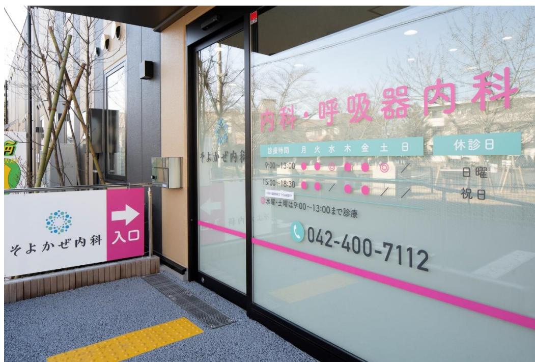
画像：そよかぜ内科外観

京王線沿線を中心に東京・神奈川にて耳鼻咽喉科有床手術センター1 医院と、耳鼻咽喉科、内科、小児科、皮膚科・泌尿器科クリニック 13 医院を運営する医療法人社団 翔和仁誠会（以下、翔和仁誠会）は、2020年2月3日、京王線・聖蹟桜ヶ丘駅近隣にグループ 15 医院目となる「そよかぜ内科（以下、本クリニック）」を開院します。本クリニックでは、総合内科・呼吸器内科を設置し、高血圧や糖尿病等の内科疾患や気管支喘息、呼吸器感染症等の呼吸器内科疾患に加え、同施設内にあるグループ耳鼻咽喉科有床手術センター「東京みみ・はな・のどサージクリニック」と連携して慢性副鼻腔炎やアレルギー性鼻炎等の耳鼻咽喉科疾患を合併する呼吸器疾患の患者様に対して総合的な医療サービスを提供します。