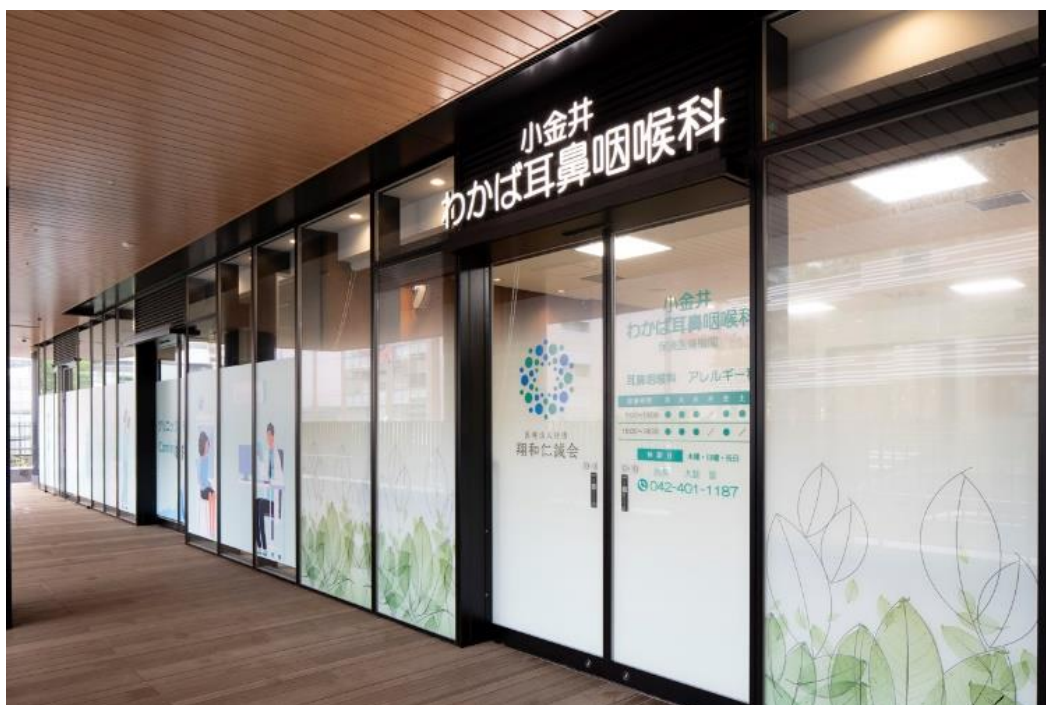
画像：小金井わかば耳鼻咽喉科外観

京王線沿線を中心に東京都・神奈川県にて耳鼻咽喉科有床サージセンター1 医院と、耳鼻咽喉科、内科、小児科、皮膚科・泌尿器科クリニック 14 医院を運営する医療法人社団 翔和仁誠会（以下、翔和仁誠会）は、2020 年 8 月 1 日、JR 中央線・武蔵小金井駅前に本年 6 月下旬にグランドオープンした地域密着型商業施設「SOCOLA（ソコラ）武蔵小金井クロス」2 階のクリニックモール内に、グループ 16 医院目となる「小金井わかば耳鼻咽喉科」（以下、本クリニック）を開院します。