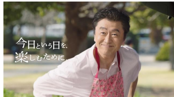
新テレビCM「娘の挑戦」篇より