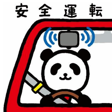
損保ジャパン 公式マスコットキャラクター 「ジャパンダ」