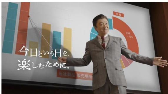
新テレビCM「プレゼン」篇より

CMの映像は、SOMPOホールディングス及び損保ジャパンのホームページと公式YouTubeチャンネルでも公開し、4月15日（金）からご視聴いただけます。