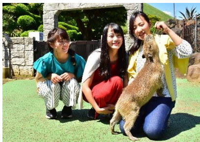
徒歩0分！「伊豆シャボテン動物公園」

1500種類の世界のサボテンや多肉植物と、約140種類の動物たちに出会える。国内でここだけの「アニマルポートツアーズ」、「カピバラ虹の広場」など距離感ゼロでふれあい体験が楽しめる。