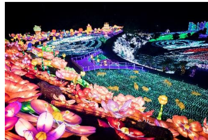
車で3分「伊豆高原グランイルミ」

約4000年前の噴火で誕生した「大室山」は、国の天然記念物であり、伊豆高原最大のパワースポットでもある。毎年2月上旬に行われる「山焼き」は春を告げる風物詩となっている。