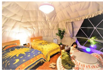
和洋室タイプ (2~5 名)