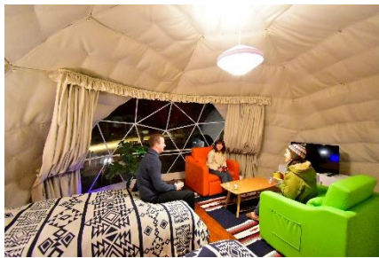
洋室タイプ (2~5 名)