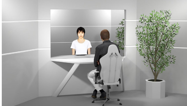
フォトリアルアバターを UI として適用した Web3.0 ウォレットのイメージ

本実証実験は、無機物であるデジタル資産保管機能であるウォレットに対し、限りなく人間に近い身体性を与え、対話型の UI によって情報のやり取りを可能にする世界初の事例となります。