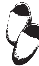
ルーム スリッポン