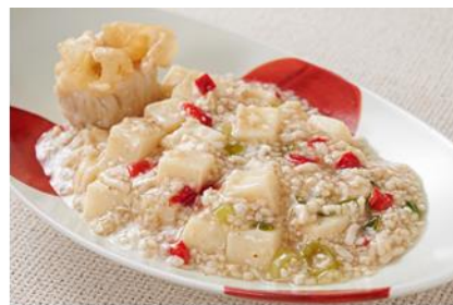
【まるやか☆白い麻婆豆腐】