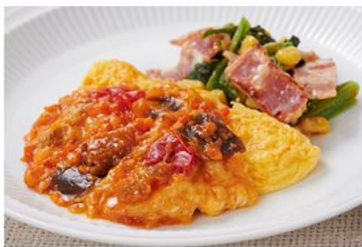
【チーズオムレットマトソース】